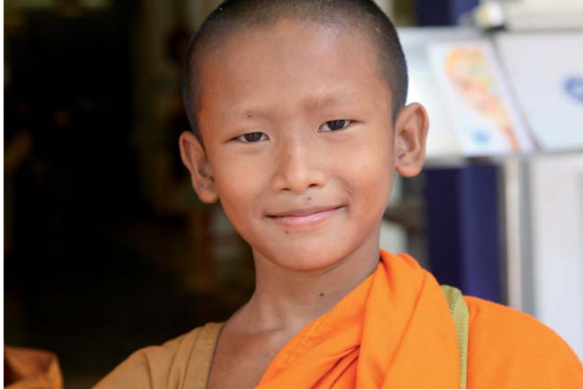
Ikaslea, Siem Reap-Kanbodia.