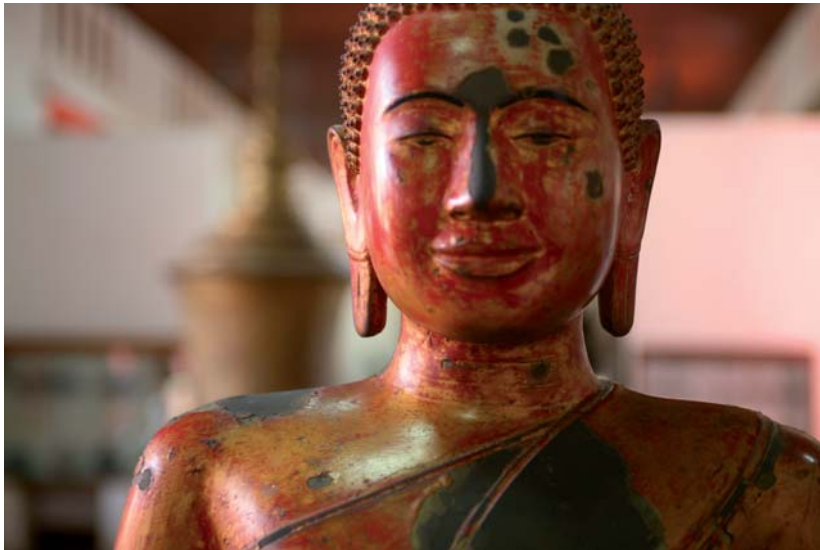
Buda, Phom Penh-Kanbodia.