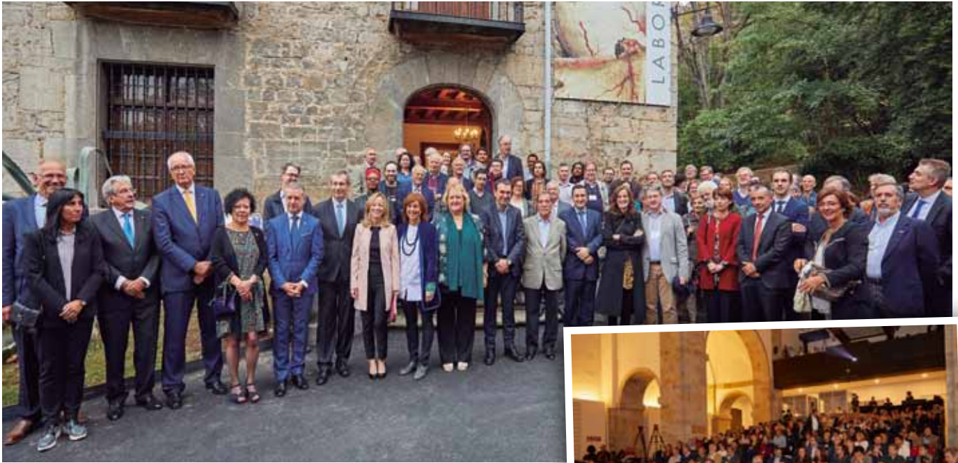
Historic Site izendapen ekitaldiaren bi une gogoangarri.