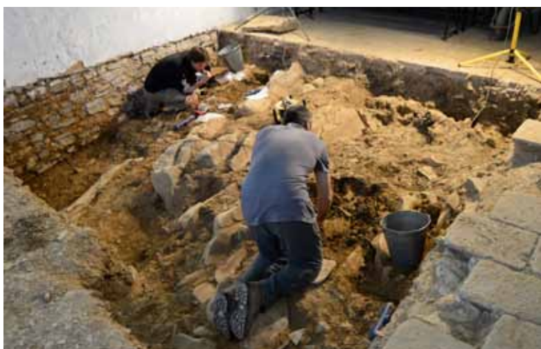
Arkeologoak ermitaren barnean lanean.

baleta-Aramaioko Murugain eta Azkoitiko Munoandiko herrixka harresituen arteko lurraldean beste asentamendu bat behintzat bazela esan lezake. Oraingoz hau behin-behineko hipotesia besterik ez da, baina aurrera begira ikerketarekin jarraitzea komeni dela adierazten digu.