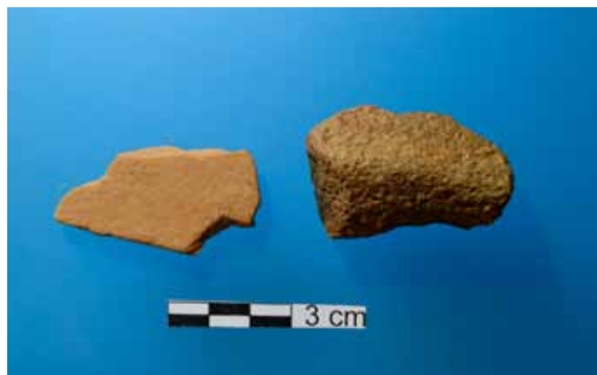
Burdin Aroko zeramikazko ontzi ezberdinen bi zati.

Bestalde, sorpresak ere izan ditugu. Ermitaren ekialde eta iparrera dagoen zelaian egindako miaketei esker jakin dugu zonalde batean Erdi Aroko aztarnak badirela baina baita aurreagokoak ere! Aurkikuntza pozgarria izan da, elizaren bai barnean (nahasturiko betelan batean), baita kanpoan ere Burdin Aroko, hau da, duela 2000-2500 urteko inguruko zeramikazko ontzien arrastoak aurkitzea. Honek Elgoibarko Moru, Arrasate-Aretxa-