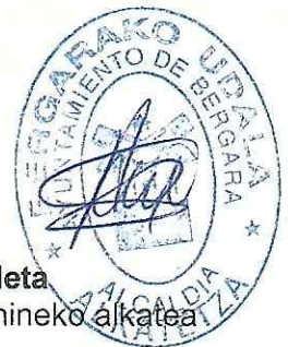
Ainhoa Lete Zabaleta

Bergarako Udaleko behin behineko alkatea