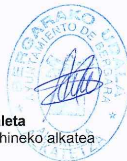
Ainhoa Lete Zabaleta Begarako Udaleko behin behineko alkatea