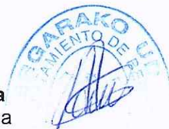
Ainhoa Lete Zabaleta Behin behineko alkatea