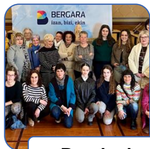
Rueda de prensa

En la figura siguiente se muestran los pasos seguidos a lo largo del proceso.