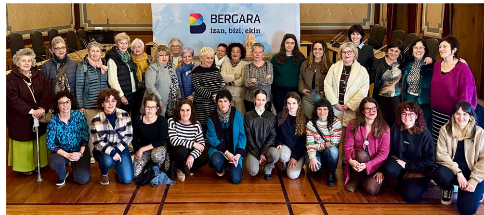
Foto: Rueda de prensa de presentación del proceso en el Ayuntamiento con el movimiento feminista, integrantes de la escuela de empoderamiento y representantes municipales. 26/02/2025

Las actas de todas las sesiones están disponibles en la página web del “Emakumeen Txokoa de Bergara”.