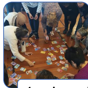
4 sesiones de reflexión