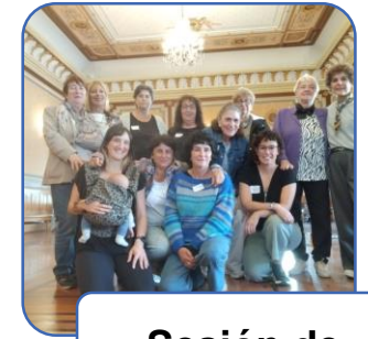
Sesión de reflexión final