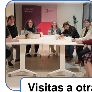
Visitas a otras casas de las mujeres