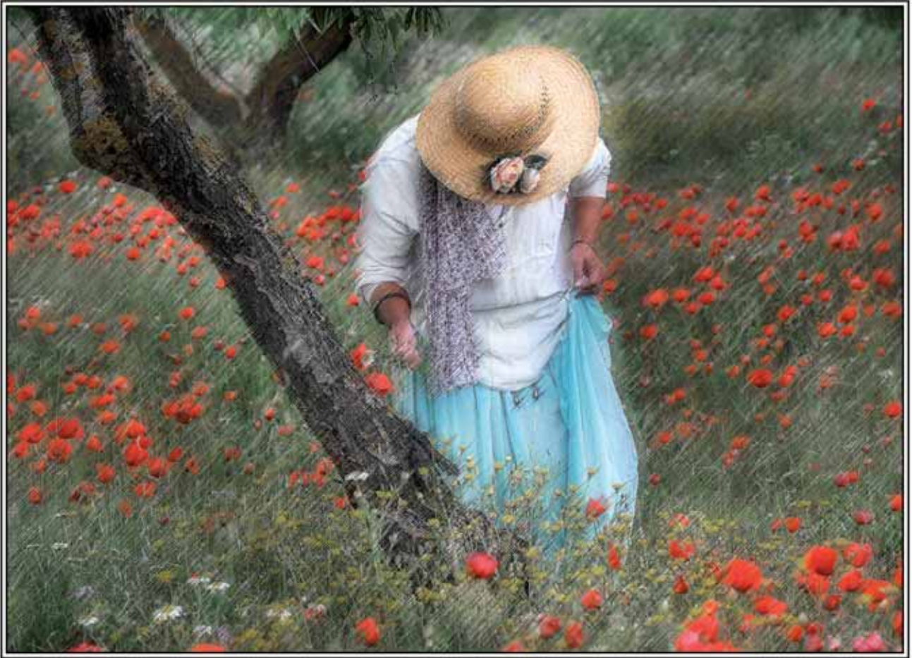
MITXOLETAK • ABABOLES