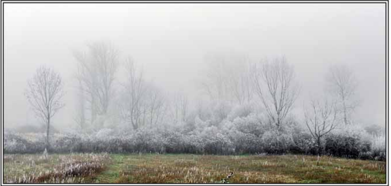
LAINOA ETA IZOTZA