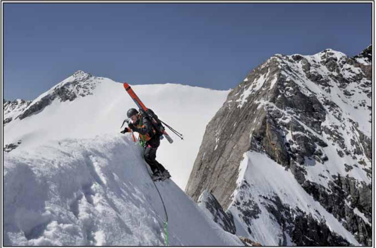
PETIT VIGNEMALEKO ARISTAN