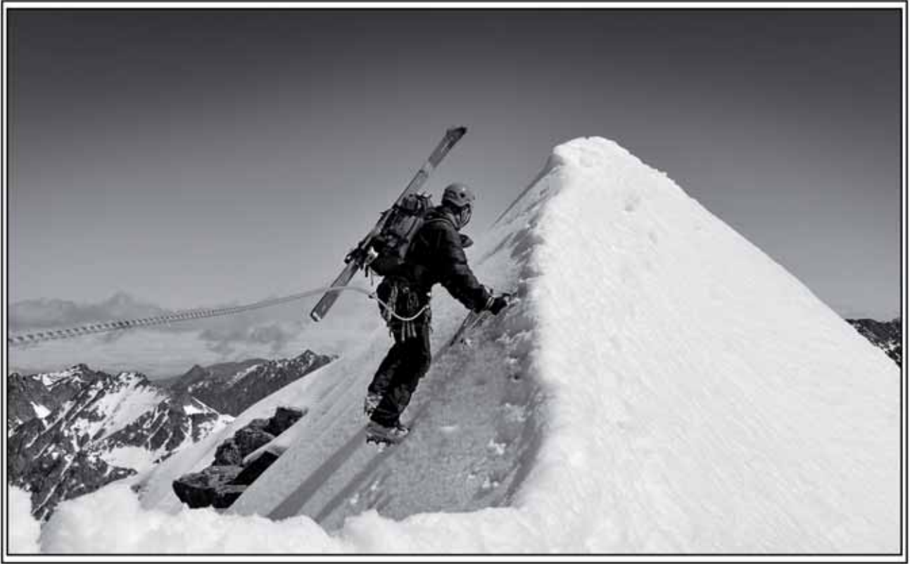
PETIT VIGNEMALEKO GAILURREAN