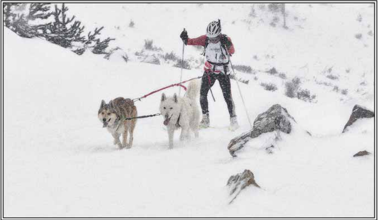
TXAKURRAK ETA ESKIAK