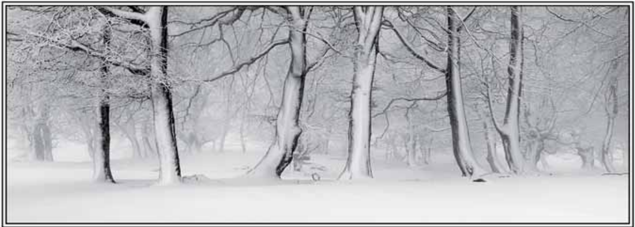
ELURRA PAGO ARTEAN